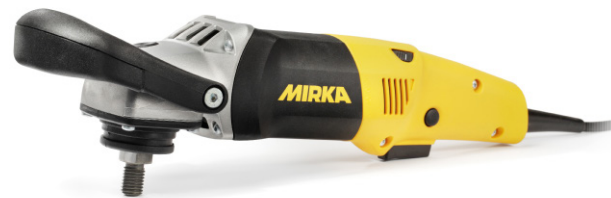
Mirka® PS1437 Pulidora, 150 mm